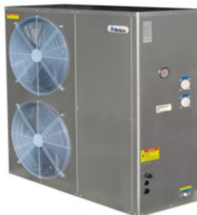
AWS 196T et 236T