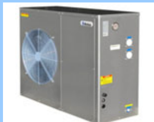
AWS 109T et 149T